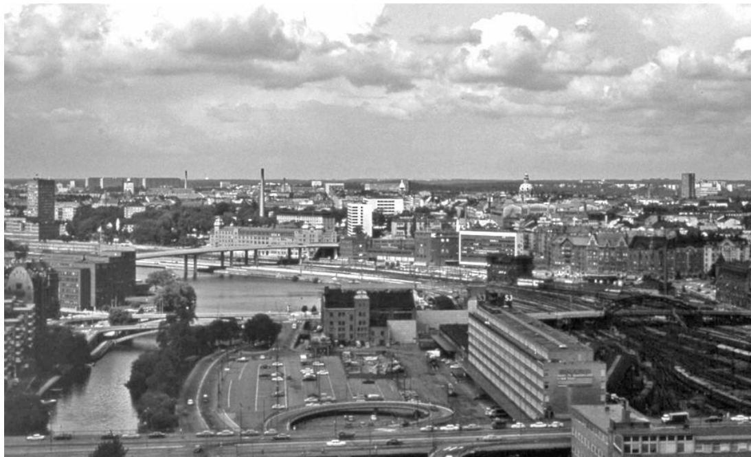
Klara sjö, Klarastrandsleden, Klaraterrassen och bangården, 1973